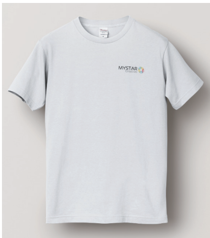
白 - 前