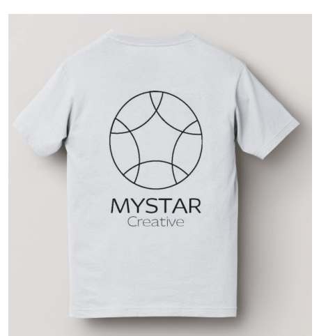
白 - 後