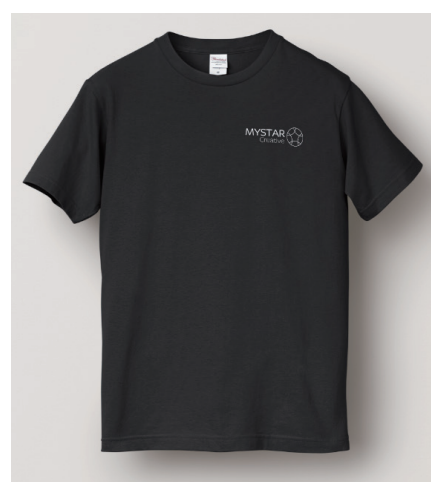
黒 - 前