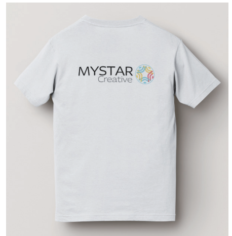
白 - 後