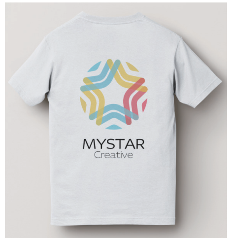
白 - 後