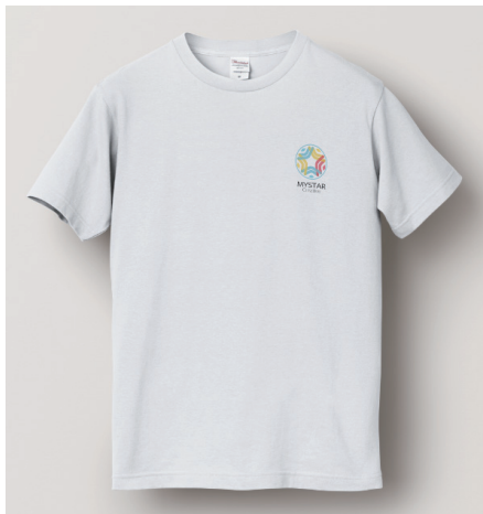
白 - 前