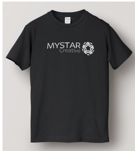
黒 - 前