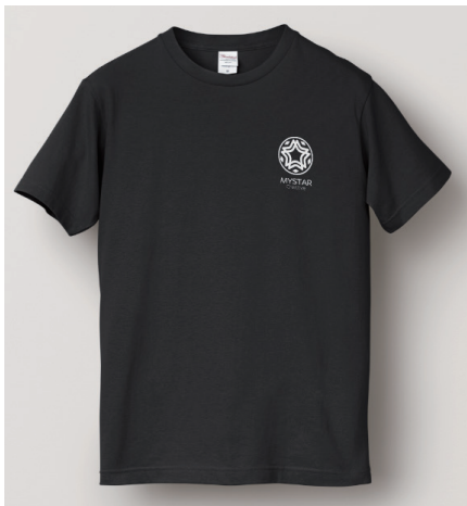
黒 - 前