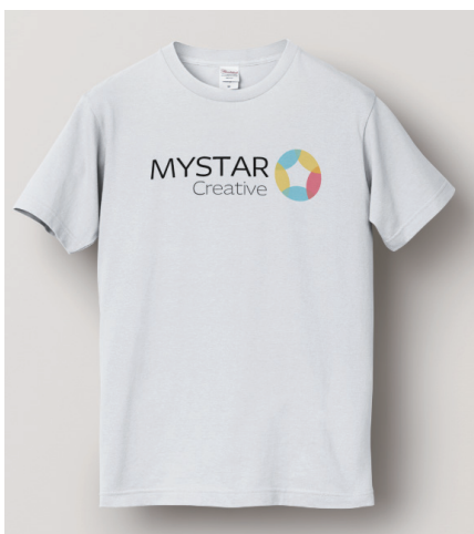
白 - 前